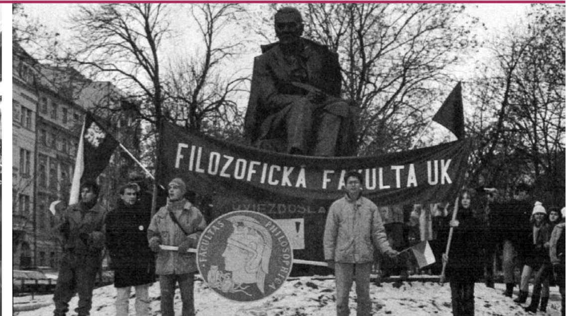
Predvoj už pod Hviezdoslavom