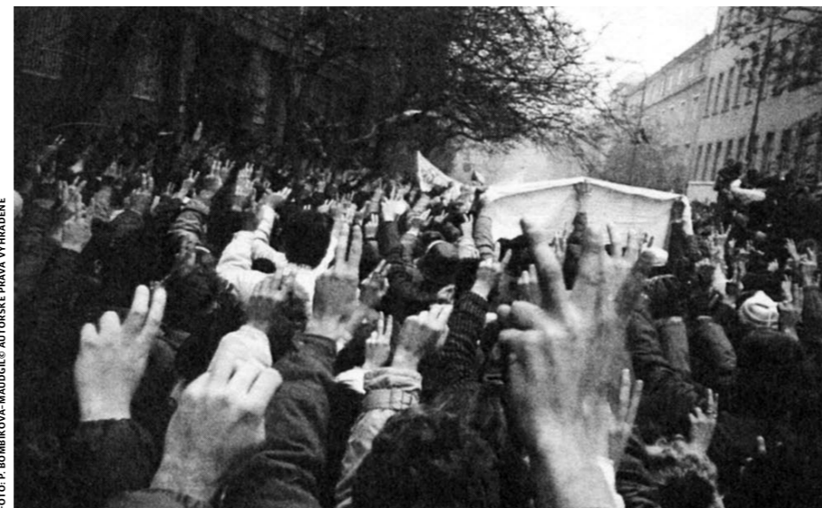
V ako Verejnost